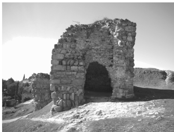
Fig. 4 – Fachada oriental de la torre, donde se abre su acceso actual, sobre el roto generado por el colapso del muro de cierre sur.