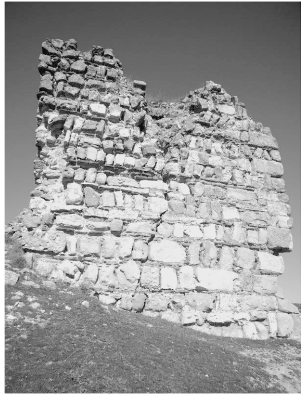
Fig. 8 - Fachada sur de la torre.