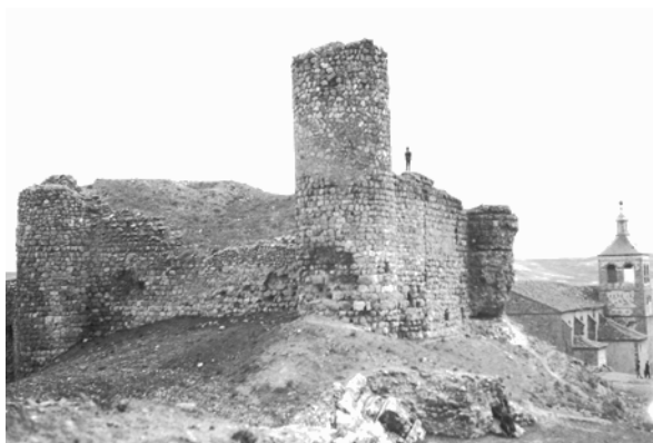
Fig. 2 – Imagen cercana del castillo tomada desde el oeste en 1932. Archivo Layna Serrano, nº 252. Diputación de Guadalajara.