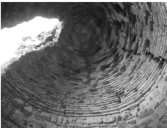
Fig. 7 - Cúpula hemisférica del interior de la torre.