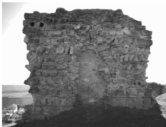
Fig. 3 – Fachada norte de la torre central, donde se ubicaba el vano original citado.