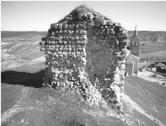
Fig. 6 - Fachada occidental de la torre principal. Nótese la huella de su unión con el muro sur.