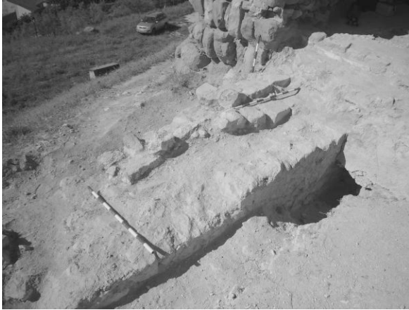
Fig. 5 - Detalle de los cimientos del cierre sur y su enjarje con la fachada oriental de la torre.