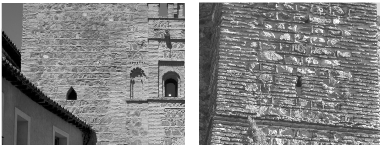
Fig. 10 – A la izquierda, detalle de uno de los vanos primitivos de la torre de flanqueo anterior a la construcción de la Puerta del Sol de Toledo. A la derecha, vano de la estancia superior de una de las torres de flanqueo de la muralla de Buitrago de Lozoya (Madrid).