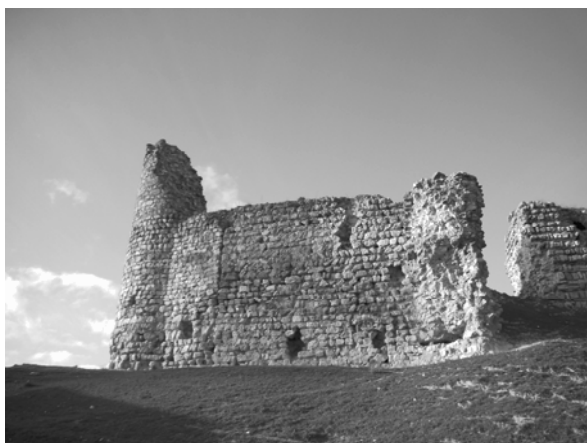
Fig. 1 – Vista del paramento sur del recinto principal del castillo.