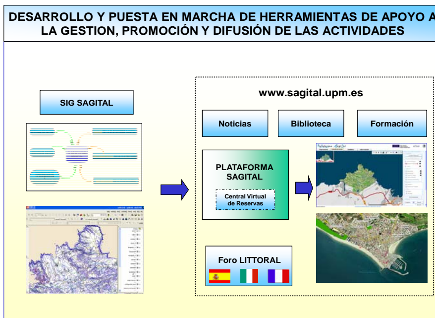
Figura 4: Esquema del SIG-SAGITAL y la Plataforma SAGITAL

Como elemento de apoyo a la implantación de las actividades de turismo pesquero, se ha desarrollado el SIG-SAGITAL, un Sistema de Información Geográfica, que incorporado en la Plataforma SAGITAL sirve para poner a disposición de cualquier usuario interesado, de una forma rápida y simple, toda la información referente a la práctica del turismo pesquero (ver Figura 4). El sistema, basado en tecnología SIG-WEB, permite el uso y la gestión de cartografía temática a distintos niveles de resolución, y facilita información sobre los servicios y puntos de interés turístico-pesqueros de cada una de las zonas objetivo. El acceso a la Plataforma se ha configurado a través de la página Web SAGITAL ( www.sagital.upm.es ), donde igualmente se puede consultar "on line" el conjunto de productos que conforman la Metodología SAGITAL para la identificación e implementación de iniciativas turístico-pesqueras.