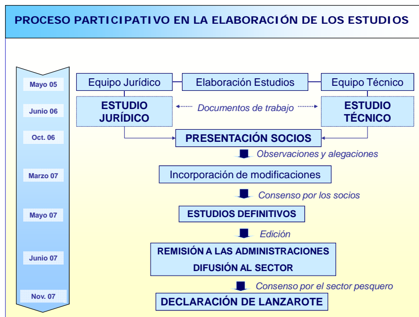
Figura 2: Esquema resumen del procedimiento de elaboración de los estudios

A partir del “Estudio sobre la ordenación jurídica de la Pesca-turismo: caracterización de la actividad, análisis del marco jurídico vigente y propuesta de regulación” realizado por un equipo de juristas de las universidades Complutense y Politécnica de Madrid, se identificaron los impedimentos legales existentes para la práctica de la Pesca-turismo y se elaboró una propuesta para la modificación de la vigente Ley 3/2001 sobre Pesca Marítima del Estado. Complementariamente se realizó el “Estudio técnico de las modificaciones a implementar en los buques pesqueros para el desarrollo de las actividades de Pesca-turismo en España”, llevado a cabo por un equipo de Ingenieros Navales de la UPM, y dirigido a establecer las adaptaciones de las embarcaciones necesarias para que la actividad de pesca turismo se realice en condiciones de seguridad y confortabilidad adecuadas.