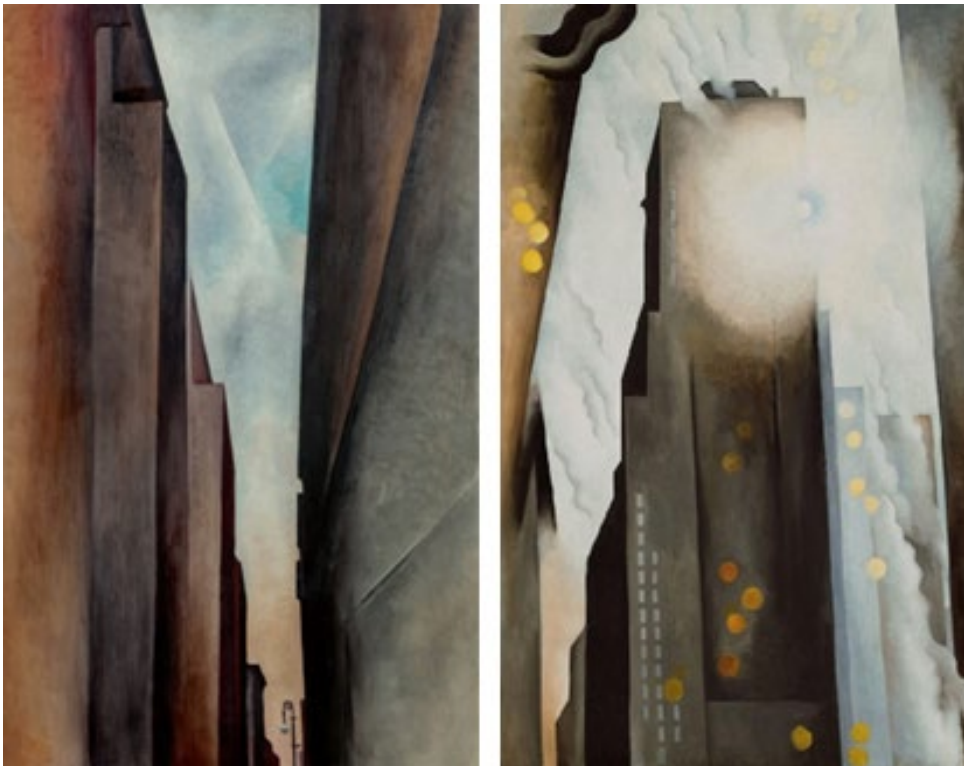
Fig. 2 Calle y El Shelton con manchas solares, por Georgia O'Keeffe. Fuente: Georgia O'Keeffe Museum, Santa Fe (1926) y The Art Institute, Chicago, (1926)

El Materialismo Histórico definió al ser humano como realidad histórica que transforma intencionalmente el mundo mediante la praxis . La acción ejercida sobre el medio para adaptarlo a sus necesidades es un acto de dominio; la arquitectura se implica en dicho acto ‘antropizando’ y construyendo imágenes icónicas Fig.2. Martin Heidegger y Arthur Danto –sin ofrecer una definición precisa del arte– coinciden en que las ‘obras’ que se pueden considerar ‘de arte’ portan un significado contextualizado (Heidegger, 1950; Danto, 2013). Y es en el ámbito de las formas significantes (Norberg-Schulz, 1974) donde cabe estudiar la arquitectura como arte. Esos significados, que no son inmutables, manifiestan la experiencia estética del existir en sus diferentes modos; existir que el ser humano experimenta a través y desde su propio cuerpo, al que también debe enfrentarse.