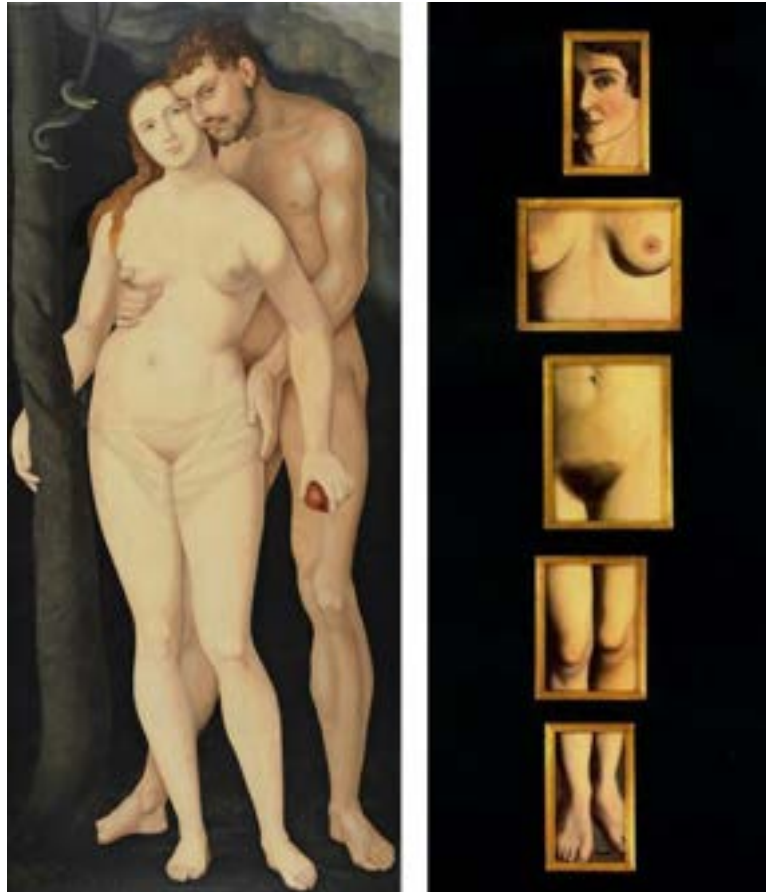
Fig. 3 Adán y Eva, por Hans Baldung Grien. Fuente: Museo Nacional Thyssen-Bornemisza, (1531) y La evidencia eterna, por René Magritte, Fuente: Menil Collection, Houston (1930)