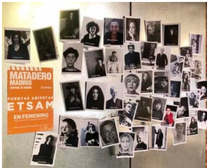
Fig. 9 En Femenino, participación de las/los estudiantes del grupo L de Historia del arte y de la arquitectura en las Jornadas de Puertas Abiertas de la ETSAM, Matadero de Madrid, mayo-junio 2022.

Para terminar con el relato de esta experiencia docente, cabe mencionar que ésta no se queda en el aula, puesto que este curso pasado se ha mostrado en la Jornada de Puertas Abiertas de la ETSAM, donde se exponen públicamente al final de curso los trabajos realizados por los/las estudiantes de la escuela. En Femenino , ha estado presente en las jornadas de mayo-junio de 2022 como muestra de la perspectiva de género aplicada a esta asignatura por quien suscribe. Fig. 9.