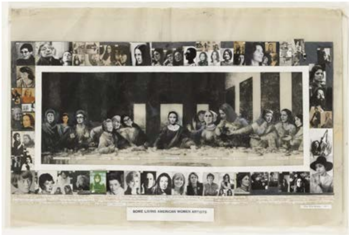
Fig. 1 Some living american women artists , por Mary Beth Edelson. Fuente: Museum of Modern Art, Nueva York, (1972)

Cuando, en 1971, Linda Nochlin se preguntó “¿por qué no ha habido grandes mujeres artistas?” Fig.1 (Nochlin, 1971) centró su atención en dos cuestiones que atañen a las mujeres en la sociedad occidental: 1. el sometimiento a un sistema de valores que no las considera iguales a los varones; y 2. la imposibilidad de desarrollarse plenamente en muchos campos, como el del arte, dentro de él. La figura de ‘gran artista’ –decía– está masculinizada en el pensamiento occidental, vinculada al ‘genio’: categoría excluyente para las mujeres. Así que responder descontextualizadamente a aquella pregunta sólo insistiría en medir a las mujeres con patrones establecidos por y para hombres, con resultados siempre negativos para ellas. Por eso, la historiadora señalaba lo errado del punto de partida: plantear la cuestión en términos del pensamiento eurocéntrico heteropatriarcal. Y ello, aun para manifestar la realidad de las mujeres, en el arte y otras actividades de proyección pública, en cualquier lugar y época: su situación de desigualdad frente a los varones. Lo importante de la argumentación de Nochlin fue la vía de salida propuesta: aplicar una mirada ‘en femenino’ a la historia, pues la masculina ni es la única posible ni, ineludible.