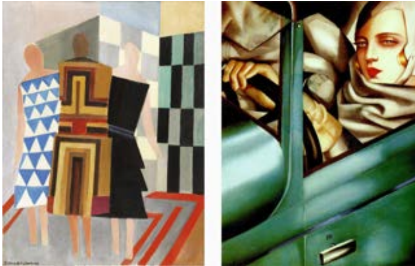
Fig. 7 Vestidos simultaneistas, por Sonia Delaunay. (1925) y Autorretrato en un Bugatti verde, por Tamara de Lempicka. (1929)