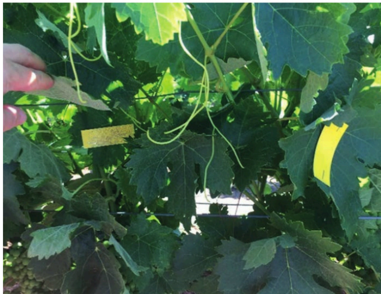
Ejemplo de evaluación de la calidad de tratamiento mediante papeles hidrosensibles.

modo de trabajo equivale al empleo de sensores de ultrasonidos convencionales.