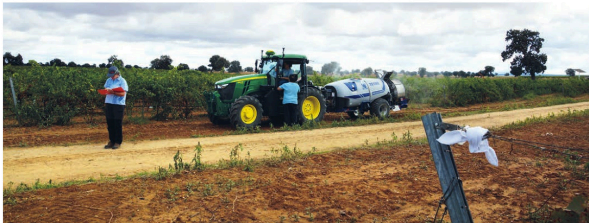
Prueba de campo realizada en la finca El Socorro del Imidra para obtener la información que se visualiza en el terminal del sistema Smart Apply, comparándola con los registros manuales de volumen de vegetación.

troválvulas de control de secciones y sus respectivos retornos tarados, y ofrece un procedimiento semiautomatizado de configuración de los parámetros de trabajo, que resulta muy práctico para un agricultor profesional y aún más para las empresas de servicios a terceros.