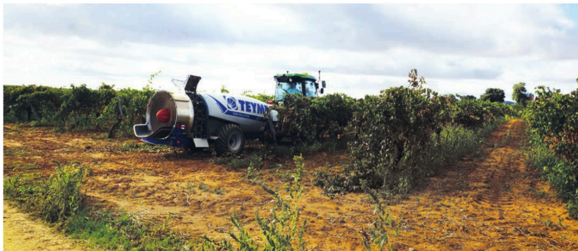
Smart Apply está instalado de manera combinada en un atomizador Teyme Eolo GTE10 dotado de tecnología Isobus.

avalado por pruebas de campo y publicaciones científicas del USDA, así como validaciones llevadas a cabo en los últimos diez años por reconocidas universidades estadounidenses (Ohio State University, Oregon State University, University of Tennessee).