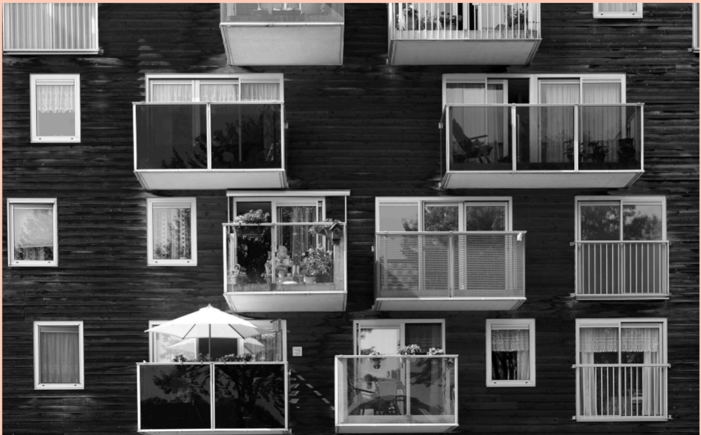
Fig. 5_ WoZoCo en Amsterdam, Holanda. 1997. Proyecto de MVRDV © Rob 't Hart.

(IB + JMM): Gracias, Jacob, por su tiempo y sus reflexiones sobre la flexibilidad, la colectividad, el medio ambiente, la productividad y las personas. Lo hemos contactado con motivo de este número especial de Dearq sobre la vivienda y le agradecemos por inspirarnos con su actividad profesional, que reúne un acercamiento visionario de la arquitectura con la realidad.