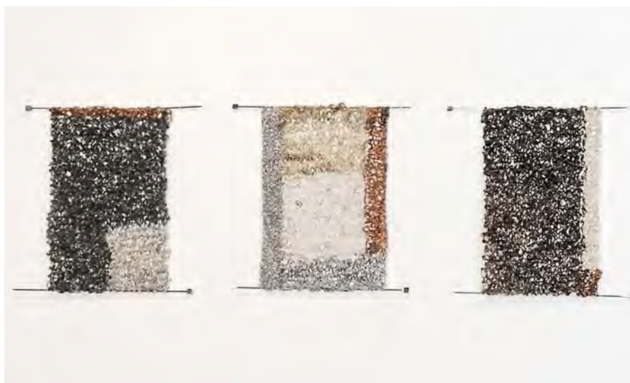
Figura 4. Tapices o banderas tricotadas.

18 Galería de Arte vinculada al estudio de Arquitectura Moneo-Brock. La exposición se vinculó al Madrid Design Festival.