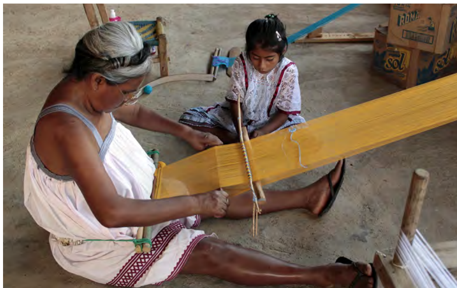
Figura 3. Mujer tejiendo. Serie de fotografías “Las mujeres amuzgas y el telar de cintura” de Mariana Rivera. © Mariana Rivera.

17 Mariana Xochiquétzal Rivera García, “El hilo de la memoria,” Encartes , Vol. 1, n° 2 (2017): 218-223.