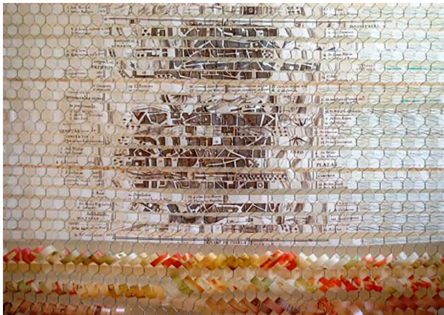
Figura 1. Detalle del Plano de Tudela. © Belén Esparza, 2022.

Que Belén tejiese con los hilos de papel de su archivo no es algo casual y se convierte en una manera poética de unir pasado, presente y futuro a través del hilo. (Fig.1)