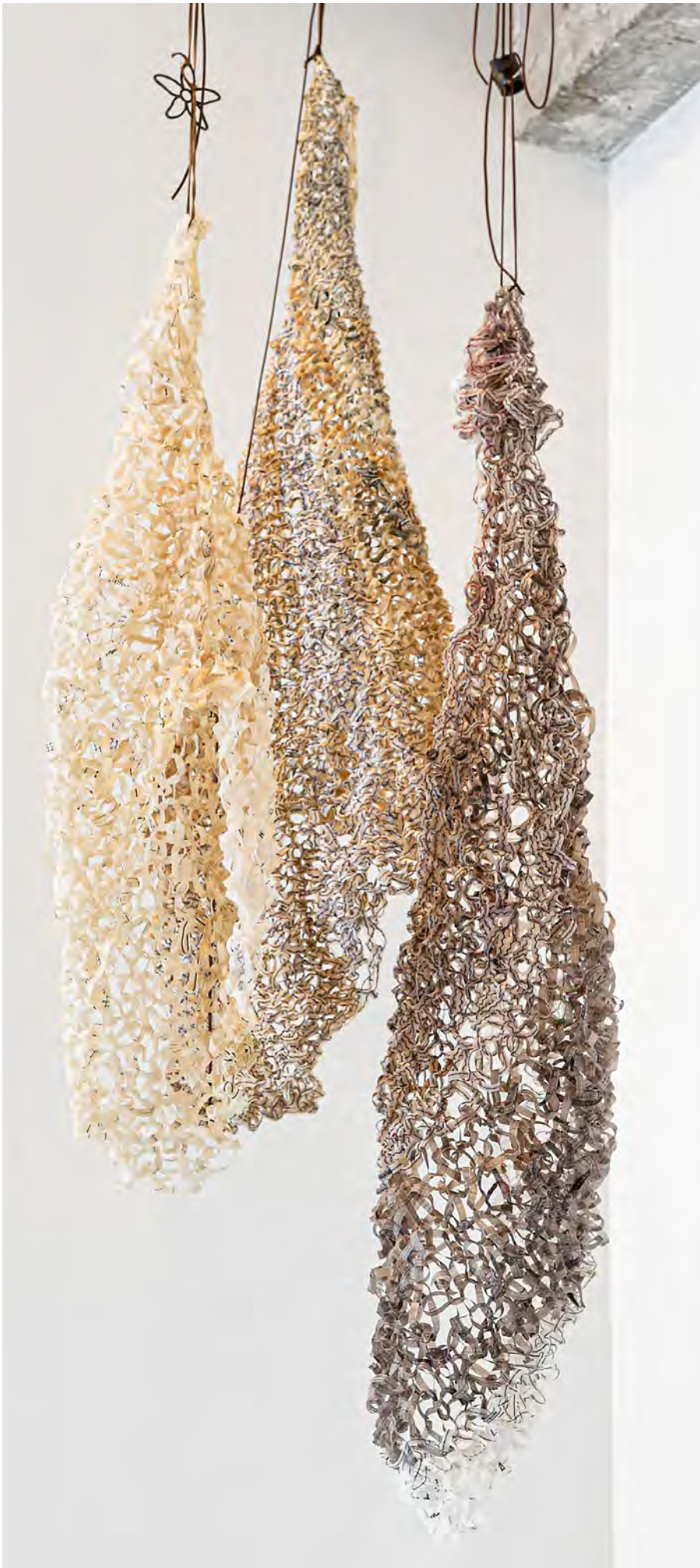
Figura 8. Detalle de una pieza tricotada "Cocoon". © Belén Esparza, 2022.