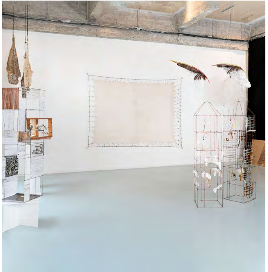
Figura 7. Vista general de la exposición de Belén Esparza en el espacio_2B space to be.

Estas obras montadas por capas necesitan el soporte de un bastidor que las confiere un carácter de caja en la que guardar memorias materializadas y que recuerdan, más en concepto que en forma, a las boîte en valise de Marcel Duchamp. El hecho de utilizar trozos enteros de planos explicita la procedencia del material empleado y hace legible la transformación de plano a tejido y de tejido a obra artística.