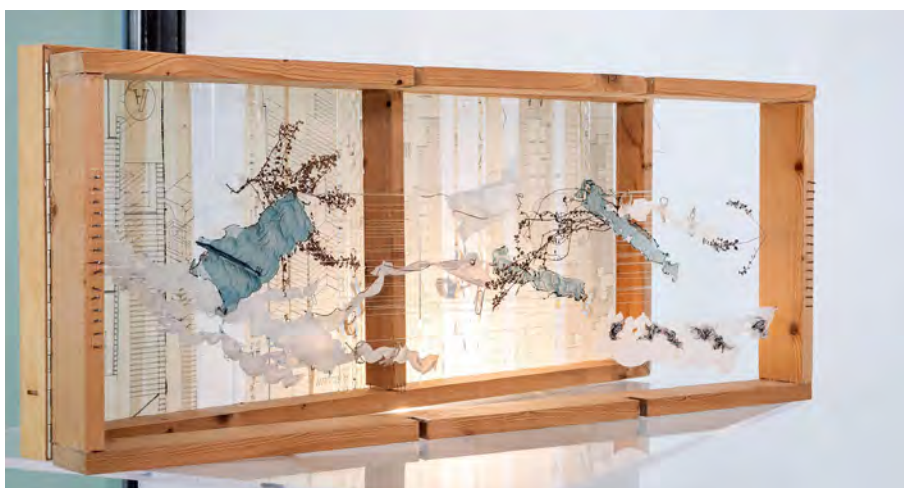
Figura 6. Detalle de "Cajas Abiertas". © Belén Esparza, 2022.

Por último, un tercer tipo de piezas, en las que los hilos del archivo se combinan con pedazos de papel, recortes de tela, hilo de nylon y objetos "encontrados" tales como hojas o ramas. (Fig.6)