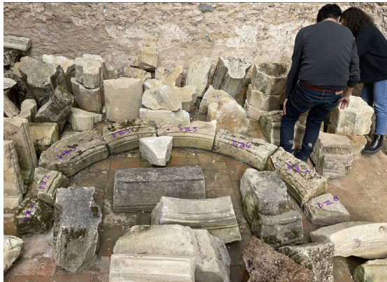
Figura 1. Algunas de las piezas encontradas en el monasterio