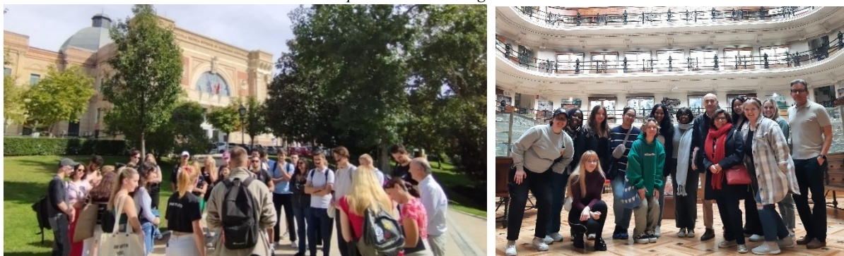
Figura 3. Imágenes de alumnos extranjeros que participaron como público y de alumnos de la UPM que se involucraron activamente (como “guías”), participando en dos paseos desarrollados. Nota: firmaron su disponibilidad para exponer sus fotografías.