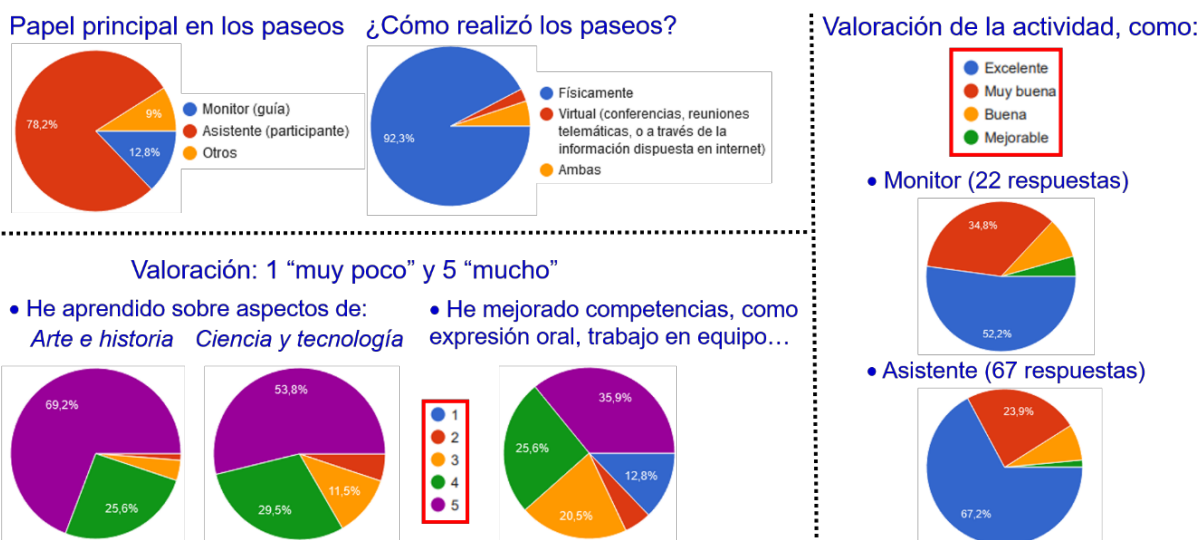
Figura 4. Algunos resultados de los cuestionarios de satisfacción de los participantes con la actividad (sobre 79 respuestas recibidas).