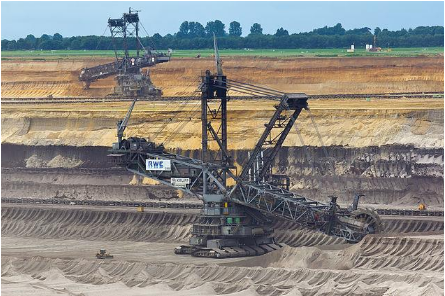
"Garzweiler Tagebau-1213"