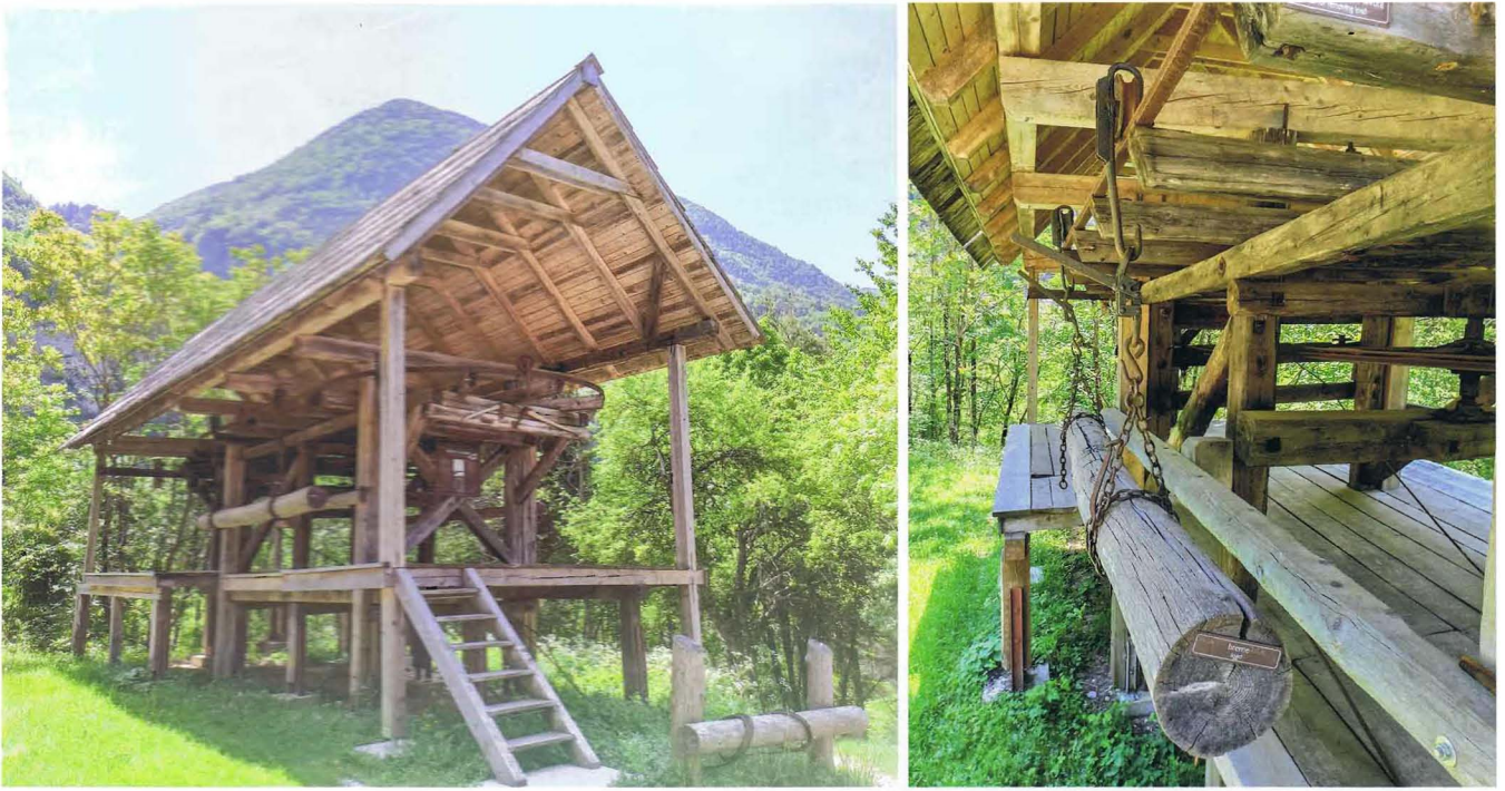
Imagen 4. Cable forestal Žičnica Golobar (valle del río Soča, Eslovenia).

Jajce (Bosnia y Herzegovina). Se tiene conocimiento de que en 1562 ya existían en esta ubicación 24 pequeños molinos. Los actuales son de la época del Imperio Austrohúngaro. El conjunto fue intervenido en 1985 y tras la guerra de Bosnia, conservando un total de veinte molinos de los cuales uno sigue en funcionamiento. Es una de las principales atracciones turísticas de la zona (imagen 3).