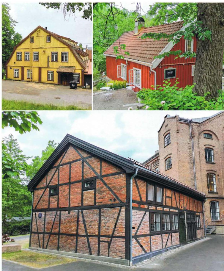
Imagen 1. Industria en el río Aker (Oslo, Noruega).

En la mayoría de los casos, las intervenciones realizadas en el patrimonio industrial en madera han venido asociadas a un cambio de uso. Por ejemplo, para museos, oficinas, viviendas, centros deportivos, centros de eventos, bibliotecas, hoteles, restaurantes, etc. Recientemente también ha surgido una tendencia a rehabilitar edificios industriales construidos con materiales diferentes a la madera, mediante su vaciado y construcción en su interior de estructuras con productos laminados de madera nueva, principalmente para uso como oficinas. Por ejemplo: el edificio Ombú en Madrid, Nest City Lab en Barcelona y las naves de Renfe en Sevilla. Al no estar presente originalmente la madera en el edificio, genera cierta controversia sobre si debe considerarse o no patrimonio industrial con madera.