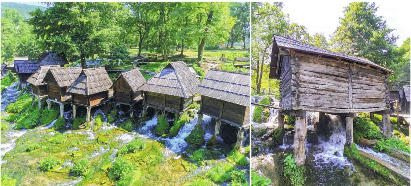
Imagen 3. Mlinčići, molinos hidráulicos (Jajce, Bosnia y Herzegovina).