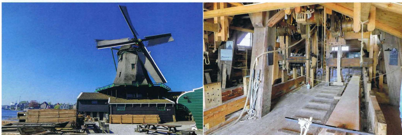
Imagen 6. Het Jonge Schaap, molino aserradero (Zaandam, Países Bajos).

La fábrica de harinas Jarošův en Veverská Bítýška (República Checa), data de 1938 (imagen 7). La estructura es de madera de abeto; los con-