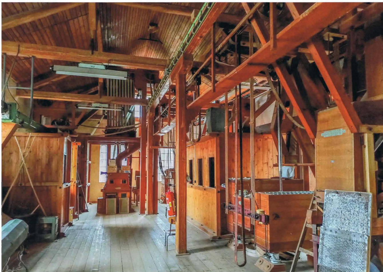
Imagen 7. Fábrica de harinas Jarošův en Veverská Bítýška (República Checa).