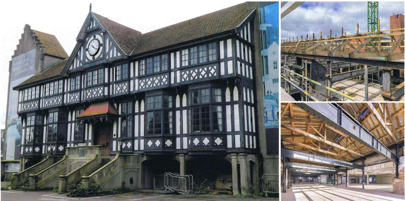
Imagen 2. Industria cervecera Beamish & Crawford (Cork, Irlanda).

Mlinčići es un conjunto de molinos hidráulicos en