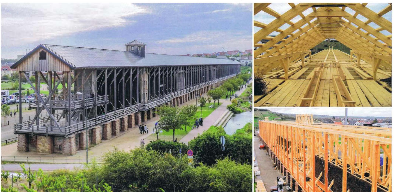
Imagen 5. Torre de graduación (Bad Dürkheim, Alemania).

de madera del monte Tolmin, construido en 1931 y que estuvo en funcionamiento hasta 1969. Tenía una longitud de 2.100 m, salvaba un desnivel de 638 m y podía transportar 100 m 3 de madera por día. Se conserva la estación inferior, reconstruida en 1956 e intervenida en 1989, cuando se construyó una cubierta para proteger la estructura de la intemperie (imagen 4). Fue declarado NSLP Nepremični spomenik lokalnega pomena (monumento inmueble de importancia local) en 1990.