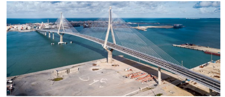
Puente de la Constitución de 1812, Cádiz, 2015

Although he tried to find the optimal solution for each case and every place, Manterola was a specialist in cable-stayed bridges, and he is the author of Spain's two such structures with the largest spans.