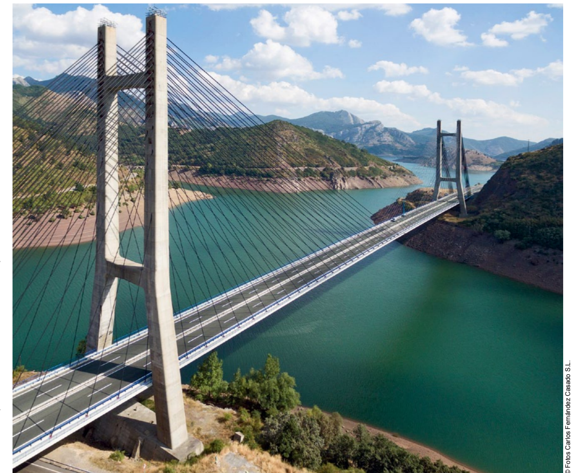
Puente Ingeniero Carlos Fernández Casado, Los Barrios de Luna (León), 1983