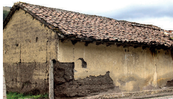
3. Provincia Chimborazo. Cantón Riobamba. Sector San Juan S 1°36'50,69" W 78°47'18,79"