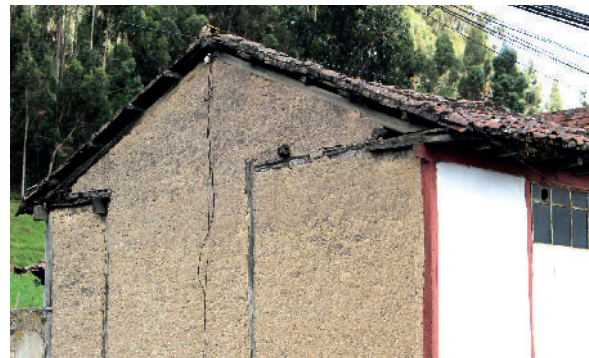
4. Provincia Chimborazo. Cantón Riobamba. Sector San Juan S 1°36'56,30" W 78°47'19,34"