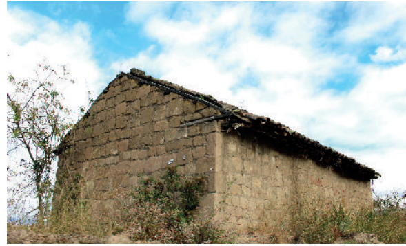
2. Provincia Cotopaxi. Cantón Pujilí. Sector Collas S 0°56'26,67" W 78°42'32,43"