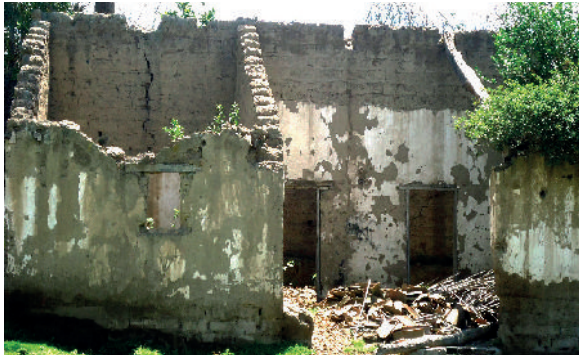
1. Provincia Pichincha. Cantón Quito. Sector Tumbaco S 0°12'59,23" W 78°22'52,04"