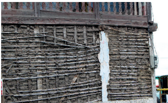
5. Provincia Tungurahua. Cantón Mocha. Sector El Rey S 1°24'44,27" W 78°39'3,33"