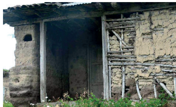
6. Provincia Tungurahua. Cantón Mocha. Sector El Rey S 1°24'18,55" W 78°38'56,36"