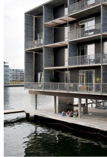
(fig. 4) Vandkysten, Teglvaerkshavnen, Copenhagen, 2009

Con esta operación de los arquitectos daneses, premio Alvar Aalto de 2009, se recuperó para la ciudad una zona portuaria e industrial degradada, con viviendas de calidad y espacios comunitarios conectados con la ciudad que afectaron al propio paisaje urbano. El proyecto aportó un modelo de intervención pronto seguido en su país y nos sirve para enlazar con otro enfoque doméstico contemporáneo esencial: la “regeneración urbana”.